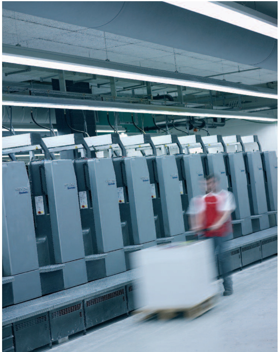
PSO-Zertifizierte Betriebe – mit Standards schnell in der Farbe und ökologisch dank Reduzierung der Makulatur.

Der Nutzen dieses Management-Handbuchs des VSD liegt im Konzept der Integration für eine nachhaltige Medienproduktion im Betrieb. Alle wichtigen Prozesse im Bereich der Nachhaltigkeit sind in diesem Werk enthalten und reduzieren somit die Schnittstellen und Redundanzen im Betrieb. Weil die systematische Prozessbeherrschung die Umweltleistung am markantesten verbessert, sind die wichtigsten Elemente von ISO 9001 sowie der Prozessstandard Offsetdruck (PSO) als wichtigstes Instrument der Qualitätssicherung im Handbuch des VSD integriert. Durch eine kontinuierliche Verbesserung der rationellen und sparsamen Energienutzung soll eine dauernde Abnahme des Energieverbrauchs für jeden Industriebetrieb als klares unternehmerisches Ziel für die Zukunft definiert werden. Optimierung der Prozesse hilft, die Makulatur zu reduzieren und